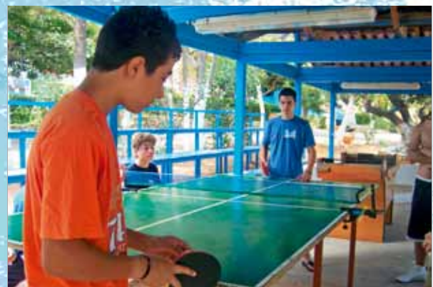
Τραπέζια Πίνκ Πόνκ