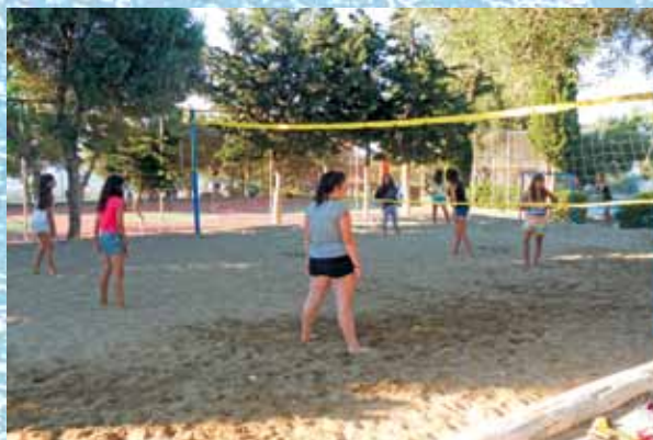
Γήπεδα Beach Volley